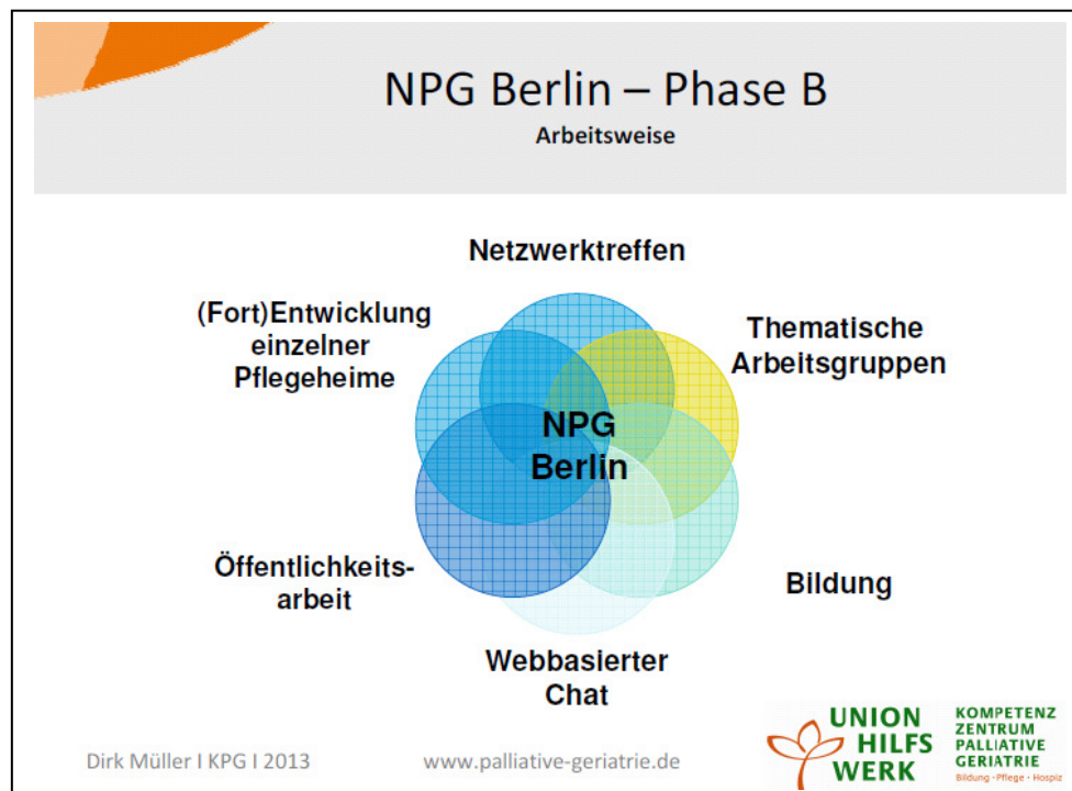
Abbildung 1: Darstellung der verzahnten Arbeitsweise im NPG Berlin.

Die Arbeitsweise im NPG Berlin gestaltete sich vielfältig. Ziel war es, die NetzwerkpartnerInnen von Anfang an unterschiedlich zu beteiligen und vertrauensvoll in Kontakt zu bringen. Die Anlage 4 dokumentiert die Anwesenheiten der einzelnen NetzwerkpartnerInnen an den Veranstaltungen. Die Anlage 5 dokumentiert die Termine und Inhalte der Netzwerktreffen, Bildungsveranstaltungen und Themenchats. Die Anlage 6 beinhaltet das „Regelwerk zur verbindlichen Zusammenarbeit“, welches alle NetzwerkpartnerInnen unterzeichneten.